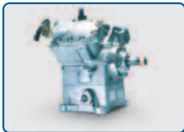
4-Zylinder-Hubkolben- kompressor für R 404A