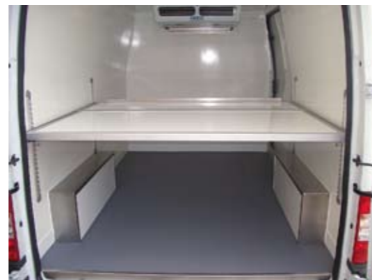
Zwischenboden GFK herausnehmbar mit Aufkantung Stirnseite (Option)