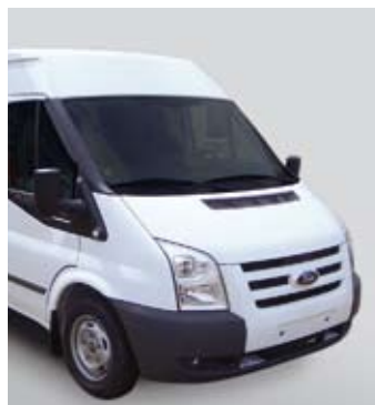
Ford Transit mittlerer Radstand