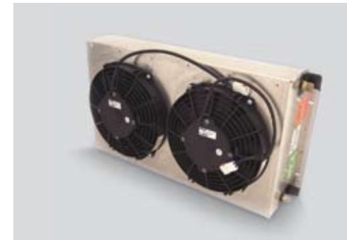
Kondensator vollintegriert (Beispiel)