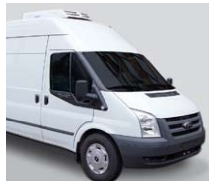
Ford Transit langer Radstand