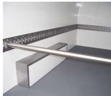
Kombi-Ankerschiene in Edelstahl für Spanngurte und Sperrstangen (Option)