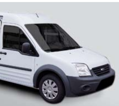
Ford Transit Connect