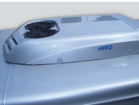
Dachkondensator in Wagenfarbe (Option)

60 MONATE GEWÄHRLEISTUNG AUF DIE ISOLIERUNG