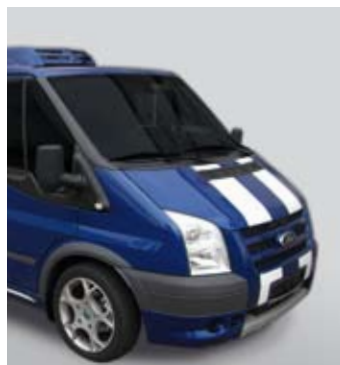
Ford Transit Sport Van