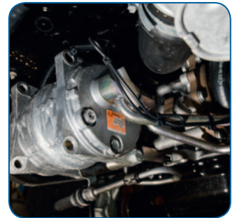
2 Kompressorhalterung auch für Fahrzeuge mit Klimaanlage lieferbar