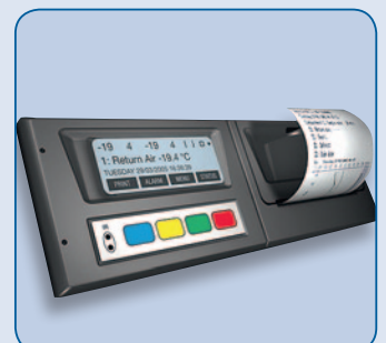
Temperaturschreiber mit Drucker