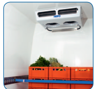
4 Leistungsstarker Verdampfer