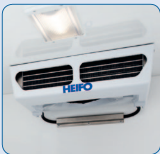
Verdampfer in vier verschiedenen Ausführungen