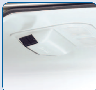
Kompaktkühlanlage FK 2650 mit außenliegendem Verdampfer