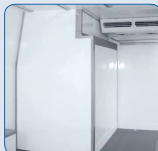
Zwei-Kammer-Kühlanlagen für unterschiedliche Temperaturbereiche