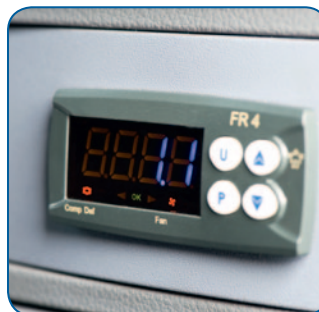
3 Fernbedienung im Fahrerhaus für eine leichte Bedienung