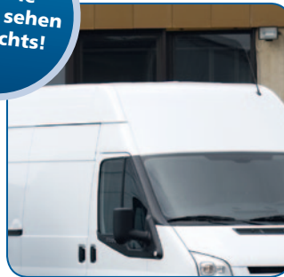
1 Kondensator auf dem Dach oder vollintegriert vor dem Kühler oder unter dem Fahrzeug