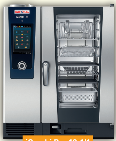
iCombi Pro 10-1/1