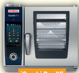
iCombi Pro XS