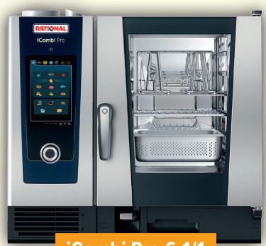
iCombi Pro 6-1/1